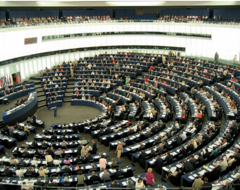
Der Plenarsaal des Europäische Parlament in Straßburg.

Allgemeine bezahlte Praktika richten sich in der Regel an Hochschulabsolventen und dauern fünf Monate. Unbezahlte Praktika sind vorwiegend Studierenden und jungen Menschen vorbehalten, für die im Rahmen ihres Ausbildungsganges ein Praktikum vorgeschrieben ist. Praktikumsbeginn ist jeweils am 1. März und am 1. Oktober. Bewerbungen müssen spätestens sechs Monate vor dem gewünschten Termin eingehen.