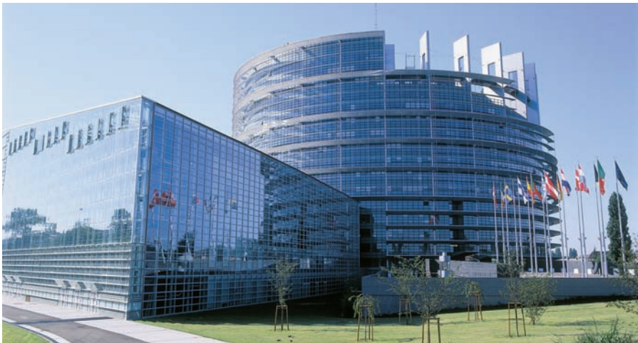
Das Europäische Parlament in Straßburg.

Grundvoraussetzung für ein Praktikum bei sämtlichen europäischen Einrichtungen sind gründliche Kenntnisse einer Gemeinschaftssprache sowie ausreichende Kenntnisse einer weiteren offiziellen Amtssprache der EU. Bei Übersetzer-Praktika werden in der Regel gute Kenntnisse von drei Amtssprachen vorausgesetzt.